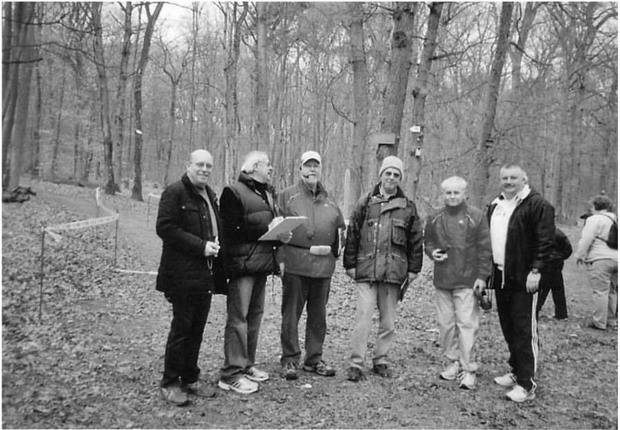
Das Kampfrichterteam Waldlauf in Mainz-Gonsenheim.