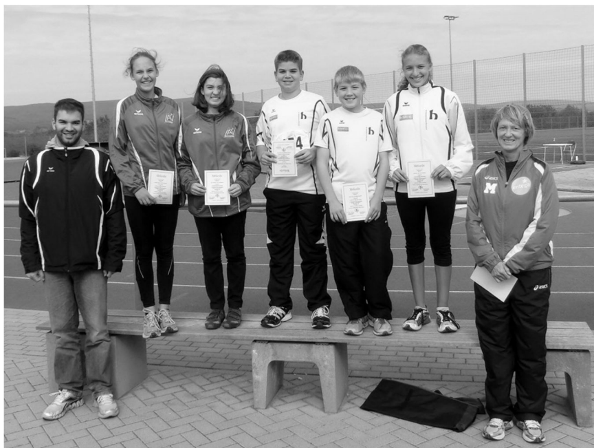
Die Gewinner des Kreiscups Mainz-Bingen.