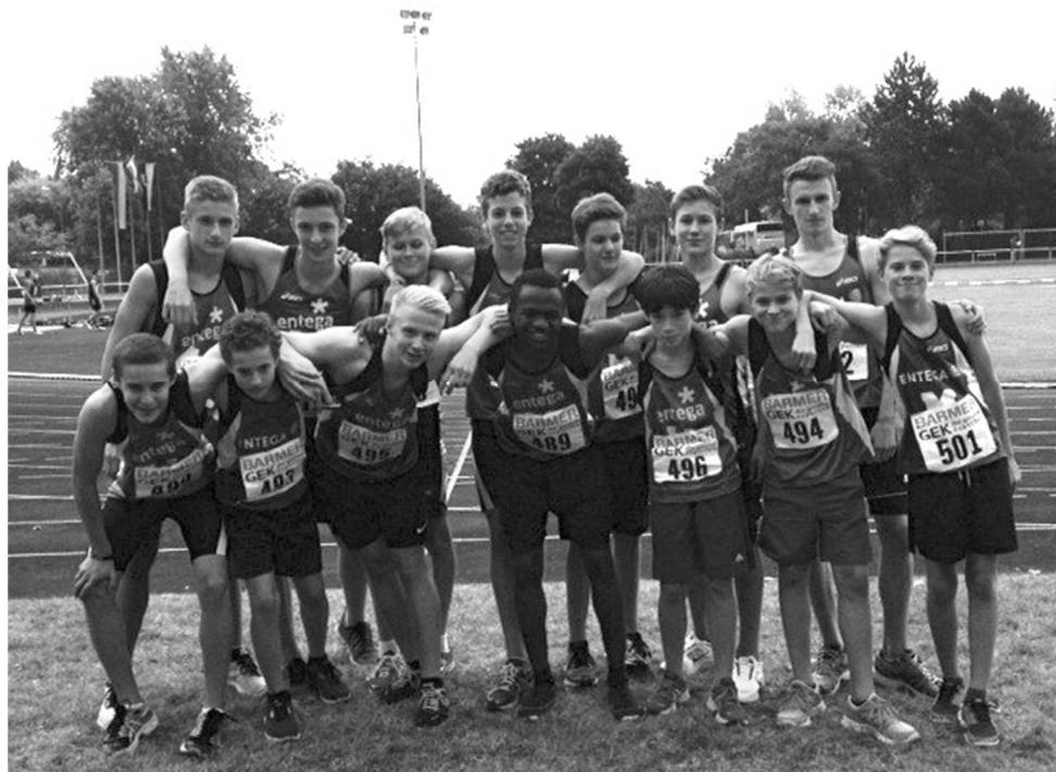
Die DSMM U16 Mannschaft des USC Mainz