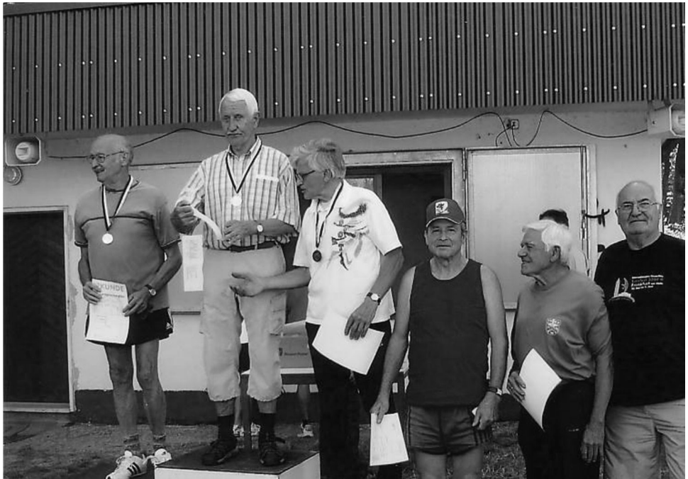
Siegerehrung M75 beim Landskronen Bergfest in Oppenheim