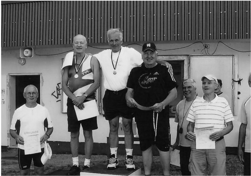
Siegerehrung M70 beim Landskronen Bergfest in Oppenheim