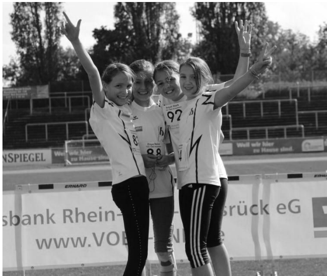
Siegreiche U12 4x50m Staffel der TSG 1848 Heidesheim beim Sportfest am 30.09.2012: